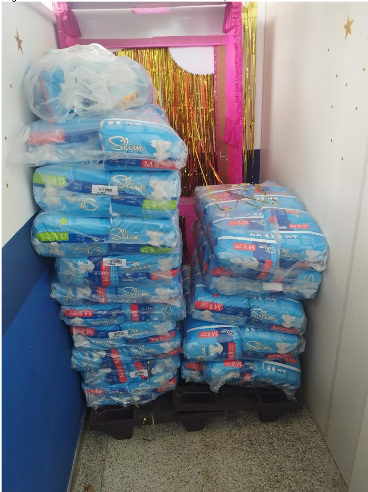
Figura 29 – AMA-UBS INTEGRADA VILA MORAES – Estoque II