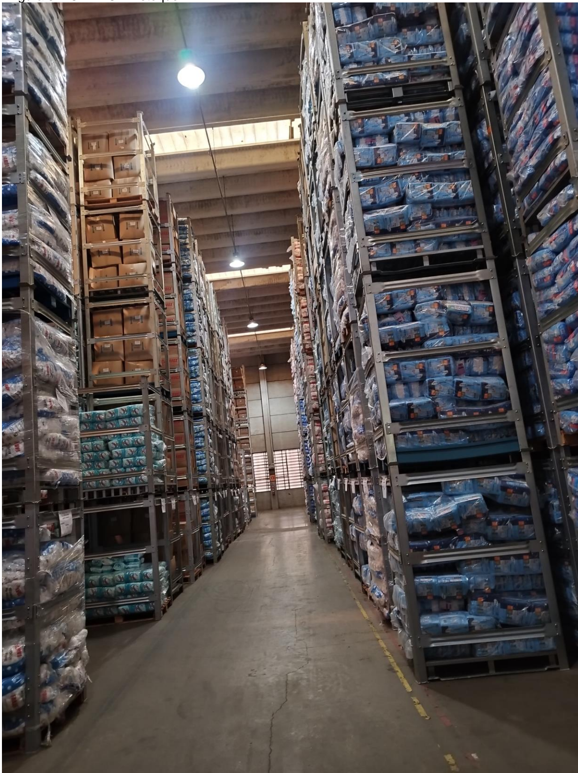
Figura 3 – CDMEC – Estoque II