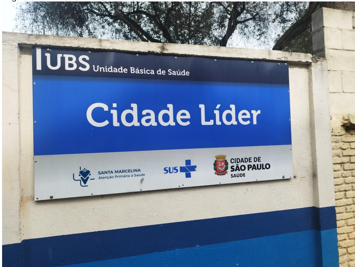
Figura 8 – AMA-UBS INTEGRADA CIDADE LIDER I – Fachada