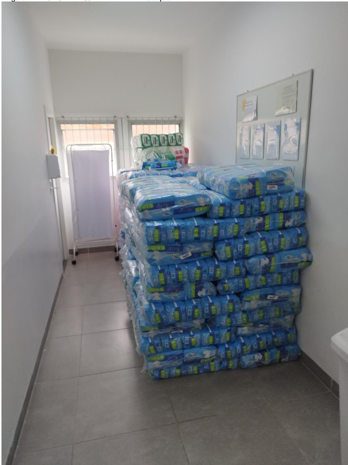
Figura 14 – UBS PARQUE DA LAPA – Estoque I