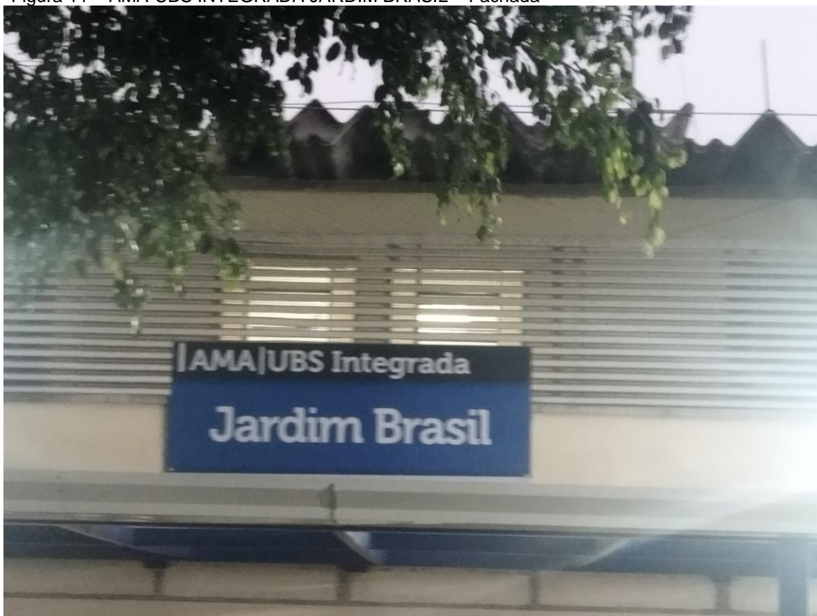
Figura 11 – AMA-UBS INTEGRADA JARDIM BRASIL – Fachada