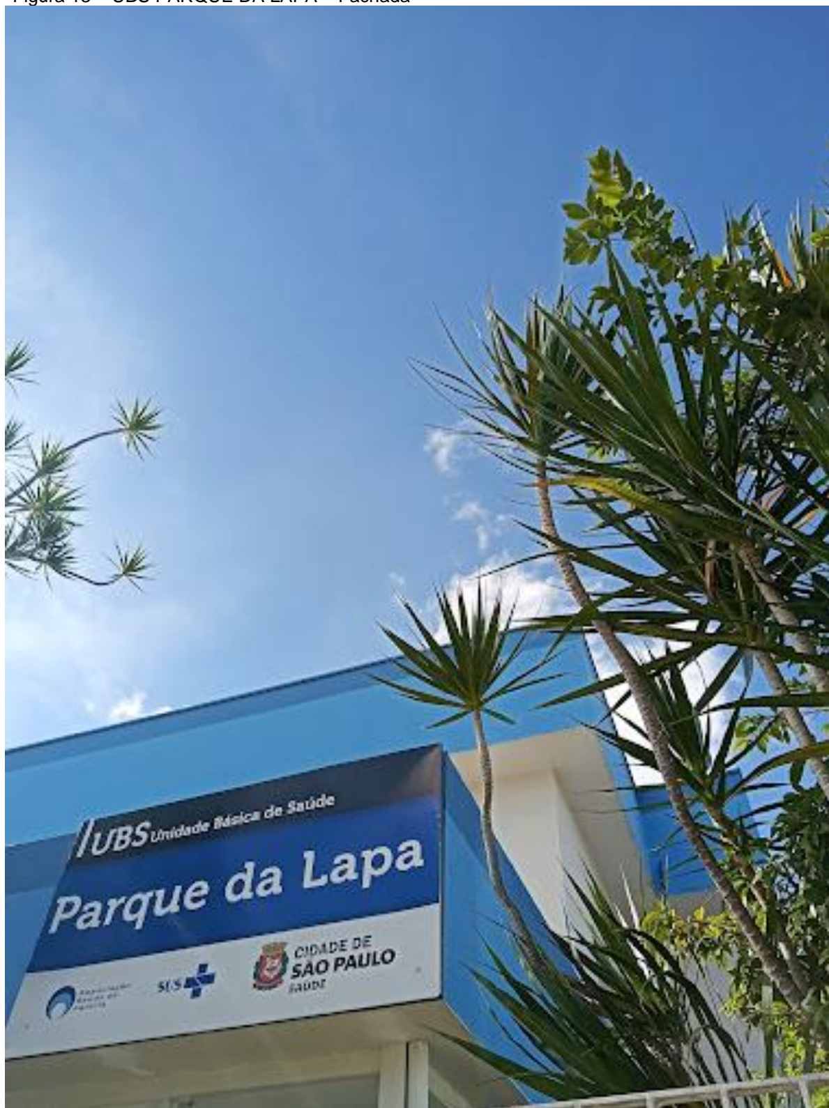
Figura 13 – UBS PARQUE DA LAPA – Fachada