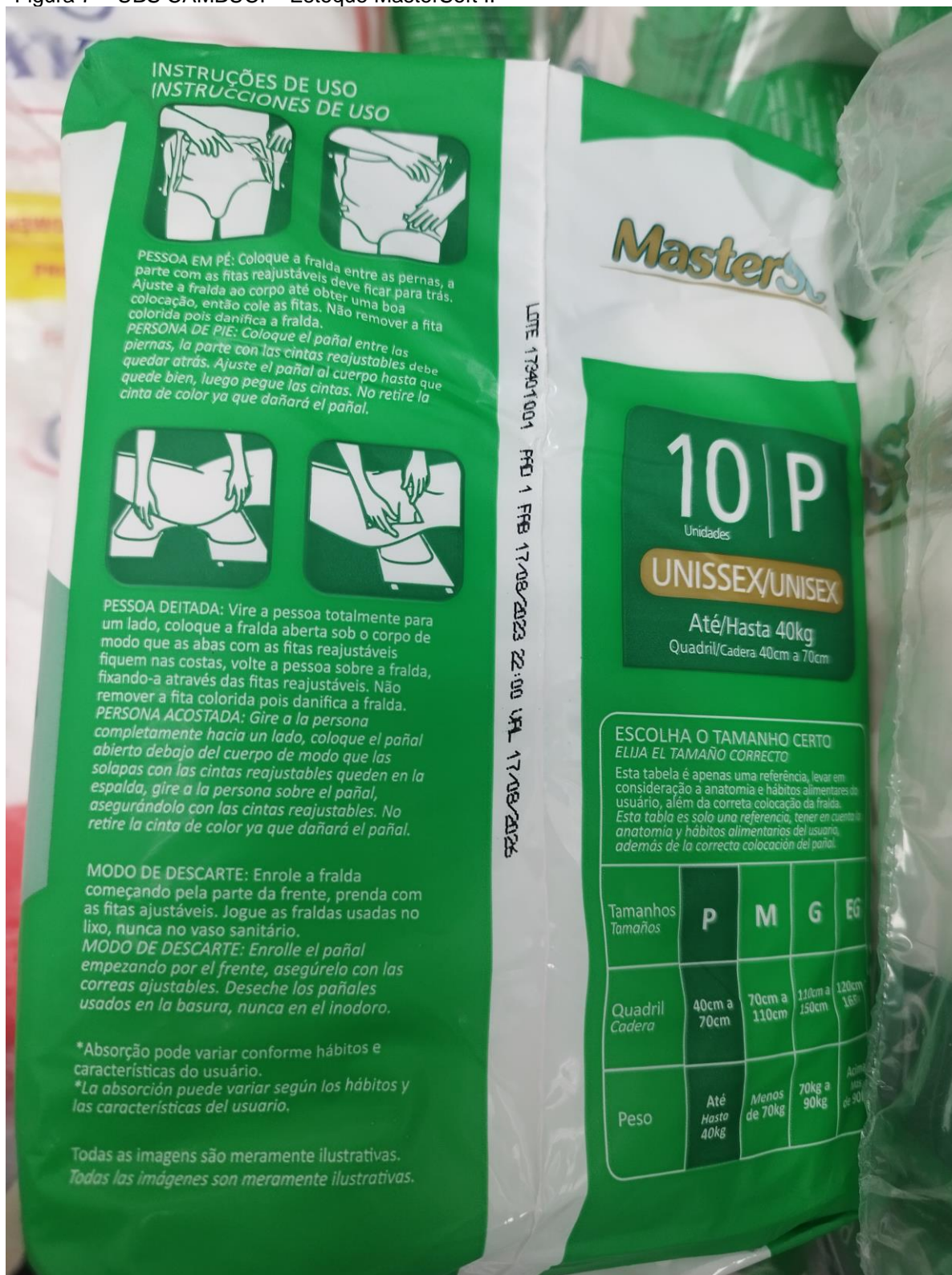
Figura 7 – UBS CAMBUCI – Estoque MasterSoft II