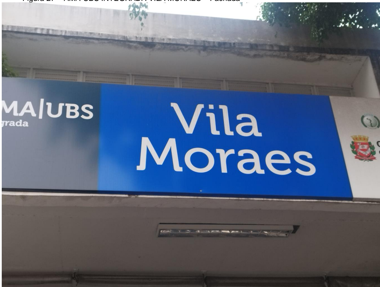
Figura 27 – AMA-UBS INTEGRADA VILA MORAES – Fachada