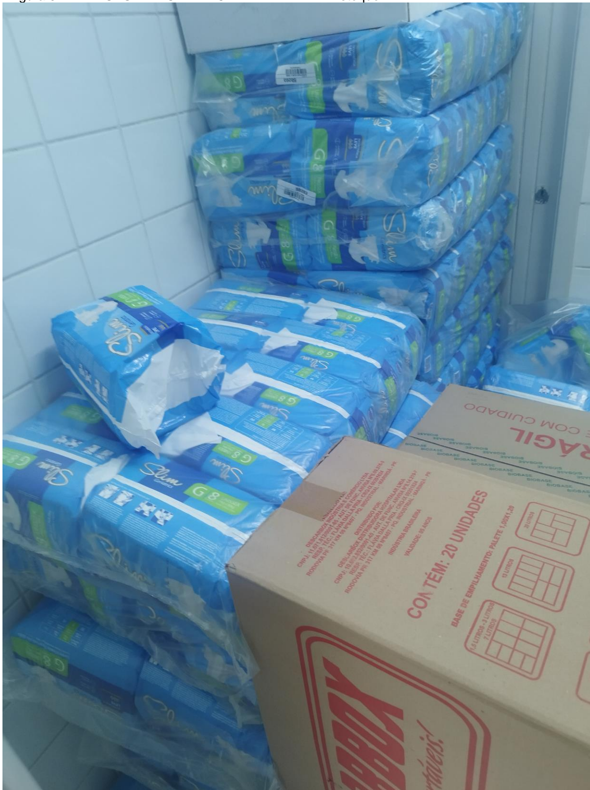
Figura 9 – AMA-UBS INTEGRADA CIDADE LIDER I – Estoque I