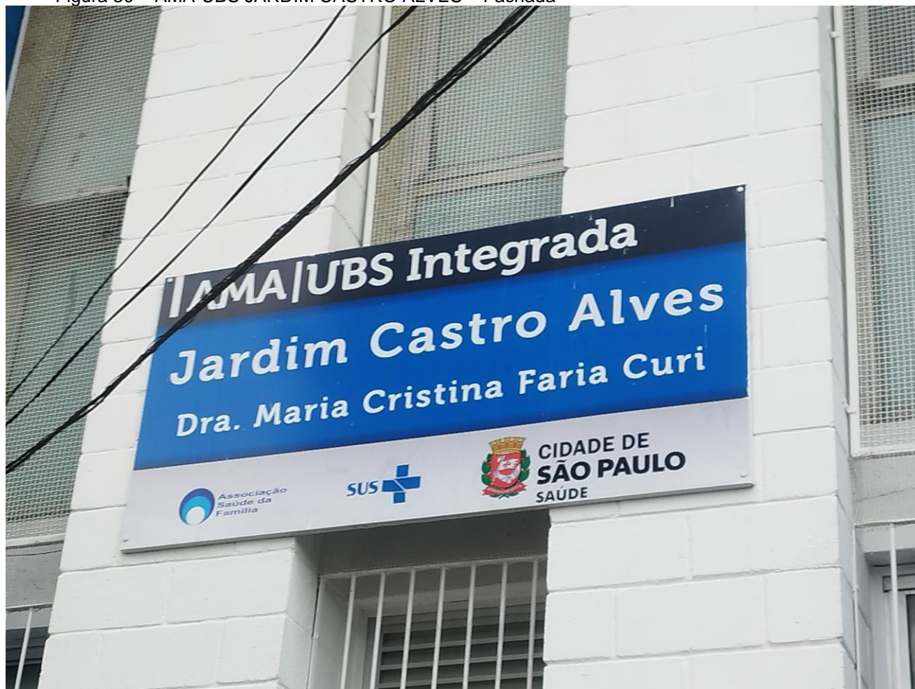
Figura 30 – AMA-UBS JARDIM CASTRO ALVES – Fachada