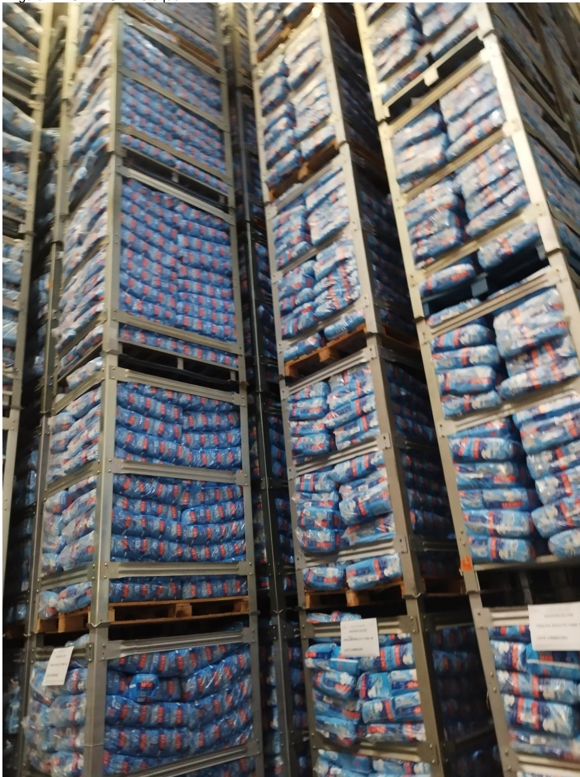
Figura 2 – CDMEC – Estoque I