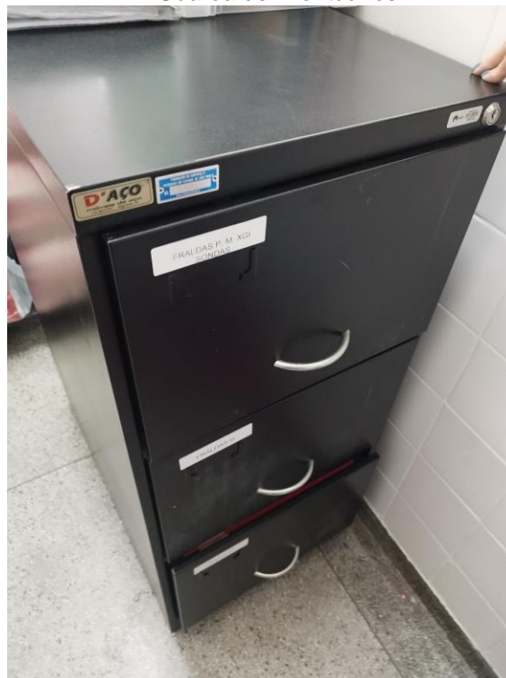
Figura 17 – UBS PARQUE DA LAPA – Guarda de Prontoúrios