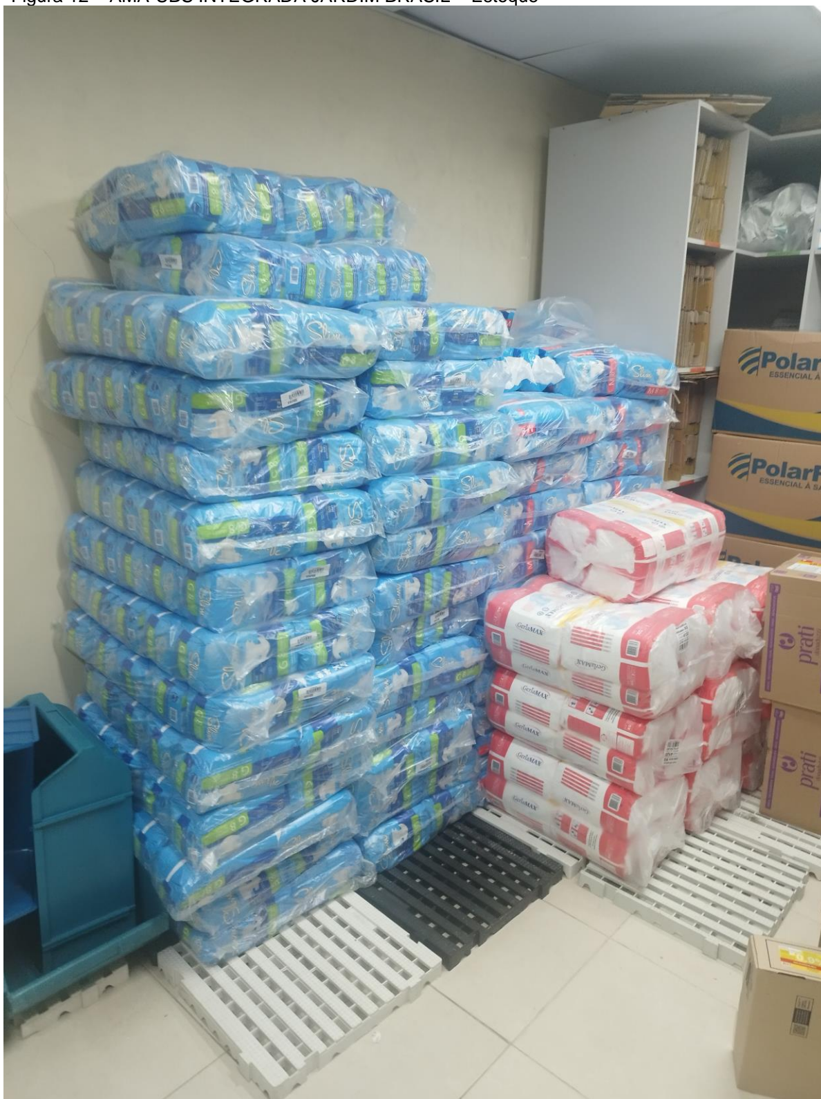
Figura 12 – AMA-UBS INTEGRADA JARDIM BRASIL – Estoque