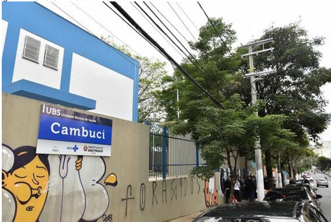
Figura 4 – UBS CAMBUCI – Fachada