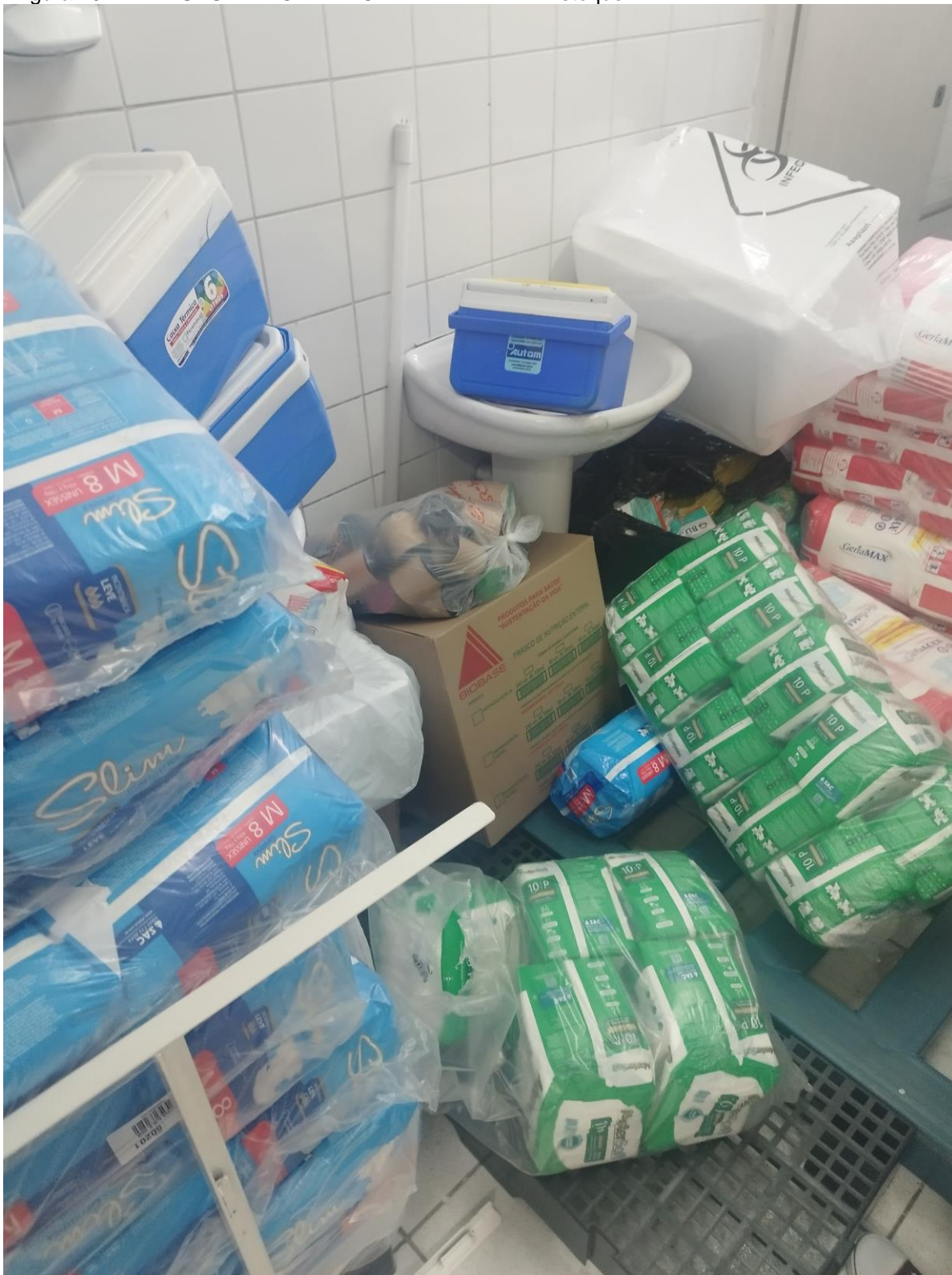
Figura 10 – AMA-UBS INTEGRADA CIDADE LIDER I – Estoque II