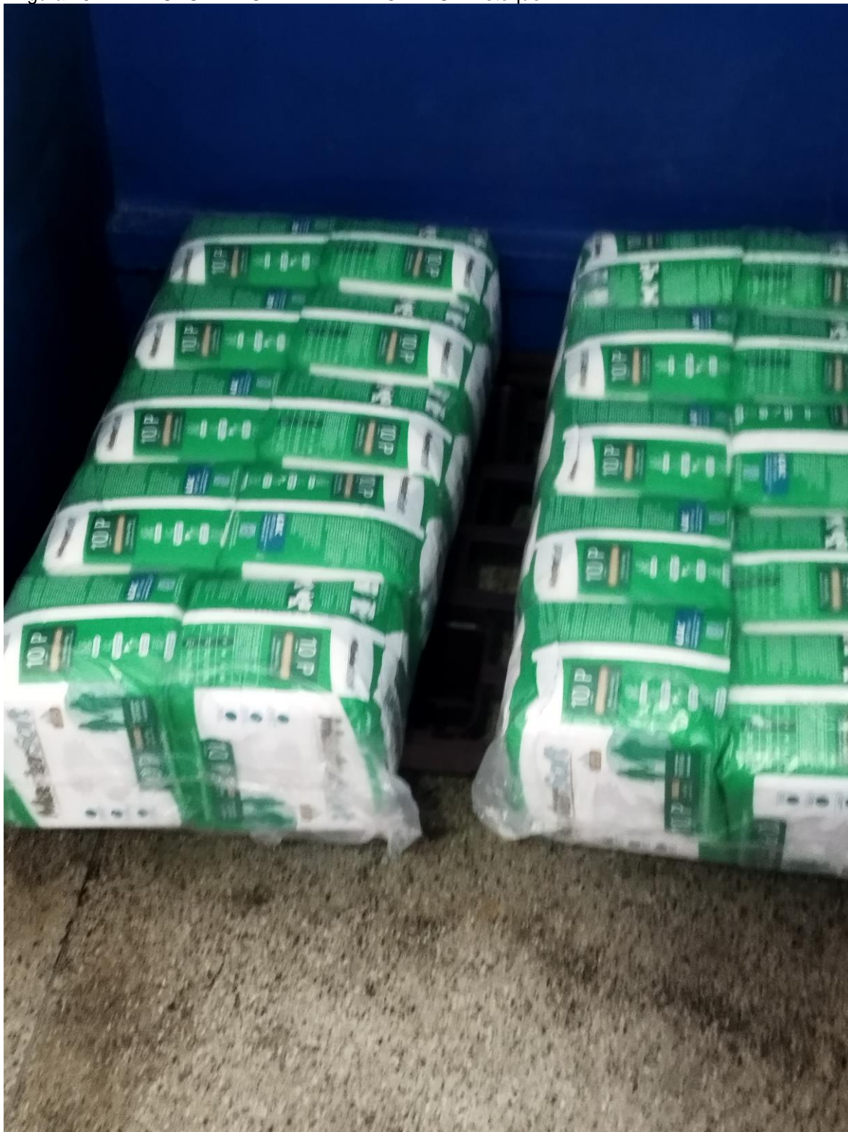
Figura 28 – AMA-UBS INTEGRADA VILA MORAES – Estoque I