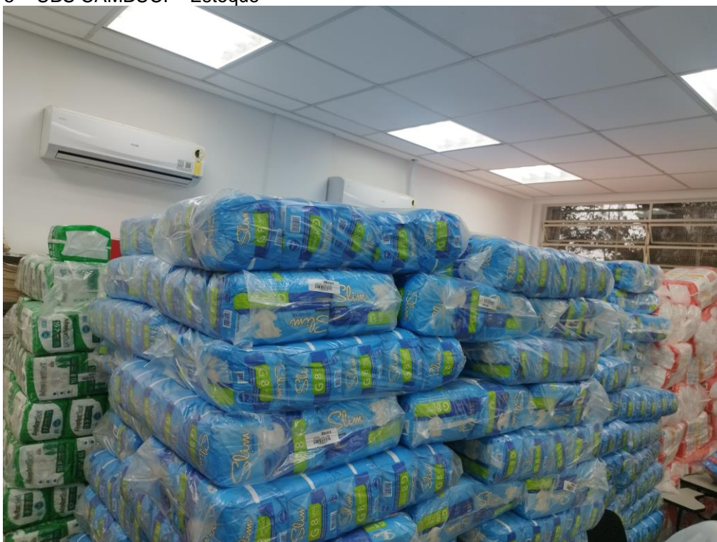
Figura 5 – UBS CAMBUCI – Estoque