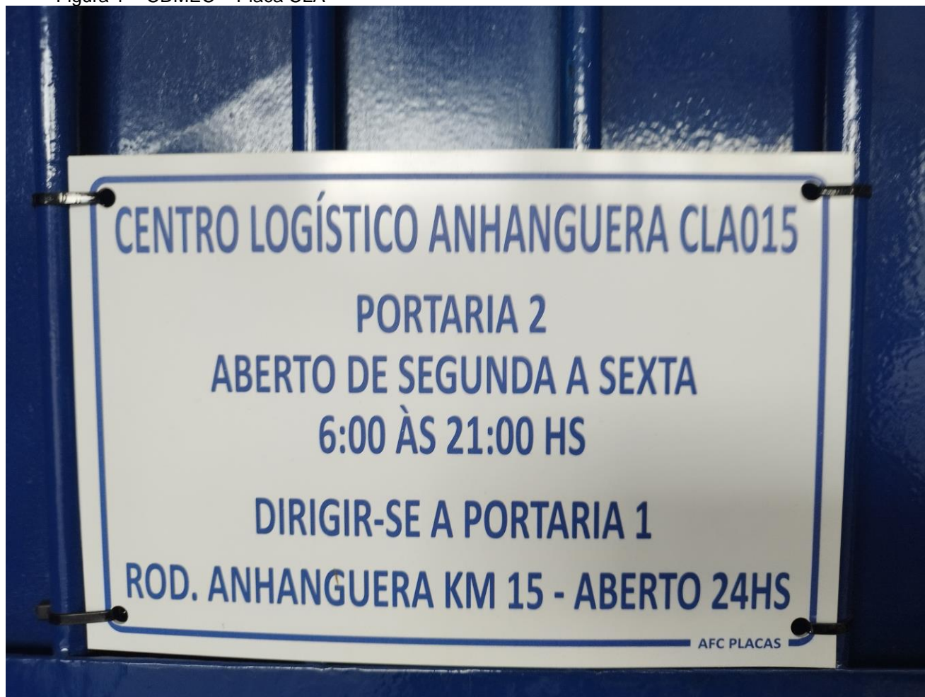
Figura 1 – CDMEC – Placa CLA