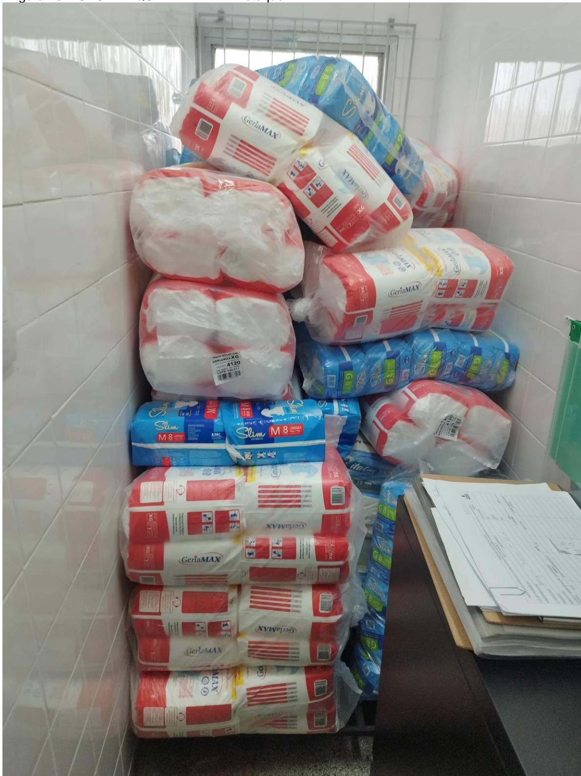
Figura 15 – UBS PARQUE DA LAPA – Estoque II