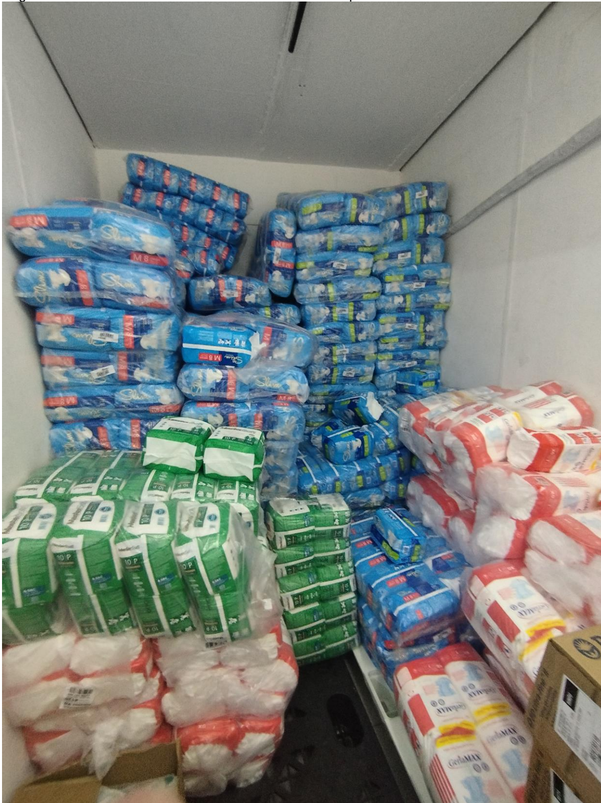
Figura 31 – AMA-UBS JARDIM CASTRO ALVES – Estoque